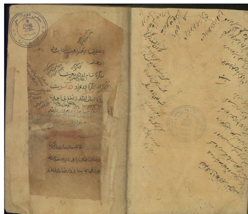
شکل ۱. صفحه نخستین از نسخه خطی شماره ۸۸۲۰ کتابخانه مجلس

تَنافُر، غرابت، مخالفت قیاس، کراهت در سمع، ضعف تألیف، تعقید، کثرت تکرار، تابع اضافات، فک اضافه، حشو و تطویل، افراط، انقطاع، اخلال،