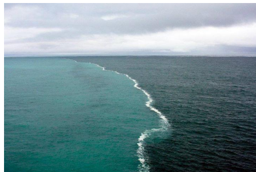
شکل ۱. آنجا که دو اقیانوس به هم می‌رسند