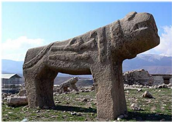
شکل ۶. سنگ قبرهایی به شکل شیرهای سنگی در لرستان

نگارندگان، وراى پیچیدگی‌های استعاره و اندیشیدن استعاری، ملهم از بازی «کلاغ‌پر»، به فرمولی ساده جهت تبیین وجود «شرایط استعاری» رسیده‌اند. پژوهشگر مسئول این مقاله در کنفرانس بوئیکای شناختی و بلاغت ۷۱ در شهر ووج لهستان به